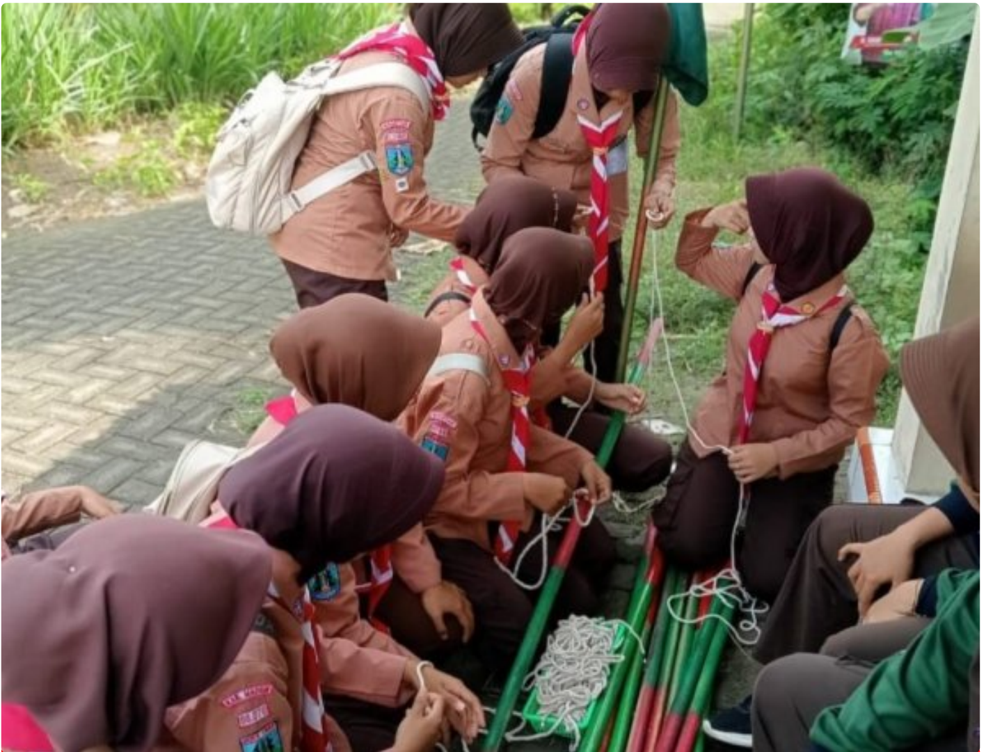
Saka Wira Kartika Koramil 0804/08 Barat Gelar Penjelajahan Dalam Penempuhan SKK

Magetan. - Saka Wira Kartika Koramil Tipe B 0804/08 Barat menggelar kegiatan penjelajahan penempuhan SKK di wilayah Koramil Tipe B 0804/08 Barat dan